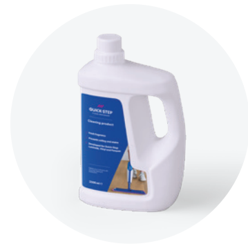
Reinigungsprodukt 1 L oder 2,5 L QSCLEANING1000 QSCLEANING2500

Dieses Reinigungsprodukt wurde speziell für die Quick-Step-Böden entwickelt. Es reinigt die Oberfläche gründlich und lässt den Boden wie neu aussehen, um das Gefühl eines „neuen Bodens“ lange beizubehalten.